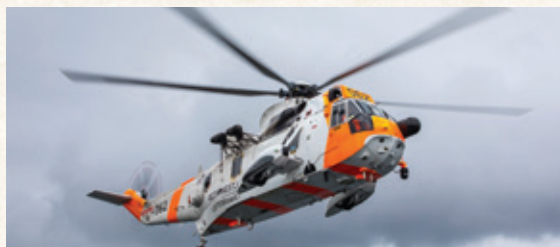
Westland Sea King Mk 43B.

Blant annet på bakgrunn av MF «Skagerak»s forlis i 1966, ble det i 1970 vedtatt at Justisdepartementet skulle anskaffe ti Westland Sea King Mk 43B helikoptre til redningshelikoptertjeneste til sjøs. Det ble vurdert slik at det ikke fantes sivile operatører som kunne påta seg å drive en slik tjeneste, og 330 skvadron ble besluttet gjenopprettet som redningsskvadron. Likevel kunne Helikopter Service påta seg en kontrakt med Justisdepartementet om å operere to Sikorsky S-61N i slik tjeneste fra 1. september 1970 til 330 skvadron var operativ 1. mai 1973.