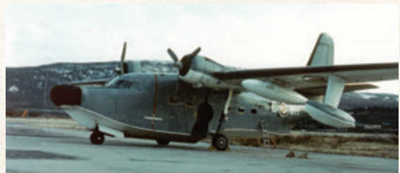
Grumman SHU-16B Albatross.

I 1961 startet oppbyggingen av 330 skvadron på nytt, denne gang igjen i maritim overvåkingsrolle med Grumman SHU-16B Albatross. Skvadronen var fullt operativ med ni fly fra 15. juli 1963. Tre av flyene var permanent detasjert på Bardufoss flystasjon. Hovedoppgavene var anti-ubåtoppdrag, men «Trossa» ble også benyttet til søk- og redningsoppdrag og ambulanseoppdrag. 1. oktober 1968 ble skvadronen på nytt lagt ned.