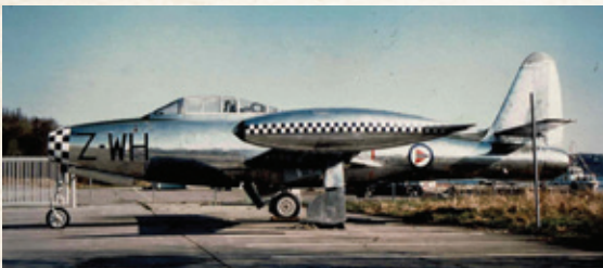
Republic F-84G Thunderjet.

330 skvadron startet flyttingen til Norge og Sola flystasjon den 13. juni 1945 hvor den opererte seks Sunderland fram til flyene ble returnert til RAF i desember 1945. 330 skvadron ble hovedsakelig benyttet til transportoppdrag mellom Sør- og Nord-Norge fram til den ble offisielt nedlagt 15. desember 1945.