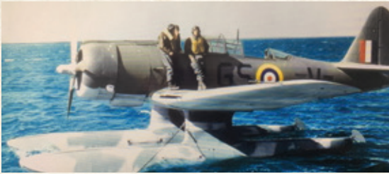
Northrop N-3PB Patrol Bomber.

330 skvadron ble offisielt opprettet på Island 25. april 1941 med betegnelsen 330 (N) Norwegian Squadron. Oppdraget var å eskortere konvoier og patruljere etter ubåter og fiendtlige fly.