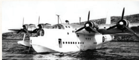
Short Sunderland Mk V.

Sammen med en Catalina fra 333 skvadron transporterte en Sunderland fra 330 skvadron den allierte våpenstillstandskommisjonen til Oslo den 8. mai 1945.