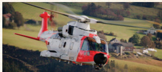
AgustaWestland AW101-612 SAR Queen.

Besetning: Den vanlige besetningen på dagens helikopter ved oppdrag er to flygere, en systemoperatør (navigator), en maskinist (helseoperatør), en redningsmann og en anestesilege. Besetningen er ansatt i Forsvaret mens de regionale helseforetakene i dag er ansvarlige for legetjenesten. På Rygge har Helse Sør-Øst ansvar for legedriften. På Sola har Helse Vest, på Ørland har Helse Midt, og i Bodø og Banak har Helse Nord ansvar for legetjenesten.