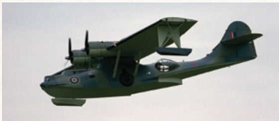
Consolidated PBY-5 Catalina Patrol Bomber.

I februar 1943 ble 330 (N) skvadron flyttet til Oban i Skottland og utstyrt med nye fly av typen Short Sunderland Mk V. Senere samme år flyttet skvadronen til Sullom Voe på Shetland der den opererte 13 fly fram til krigens slutt.