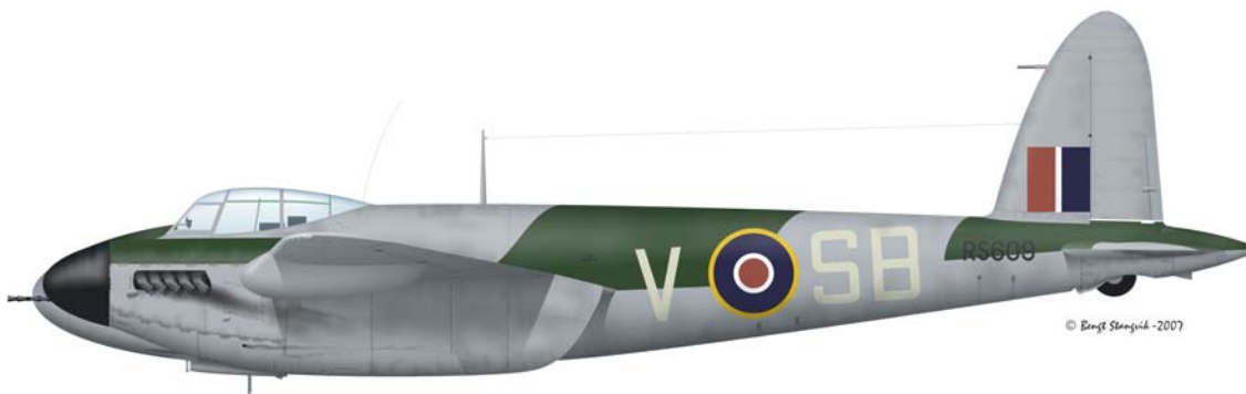
Kopi av Hermans fly hva angår merking og farger. Tegning: Bengt Stangvik, Bodø

Mosquito SZ 999 med Dawson og Murray om bord ble skutt ned av tysk antiluftskyts på returfasen i lav høyde over Nyrup Bukten nord for Nykøbing på Skjelland. Begge omkom.