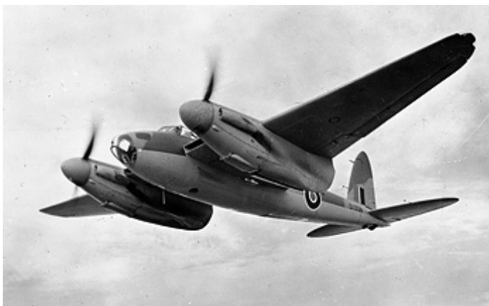
Tomotor Mosquito jagerbomber på vei mot Shellhuset. Vingerammer og skrog var bygget hovedsakelig av tre, noe som gjorde flyet ekstra sårbar med tanke på treff fra luftvern.