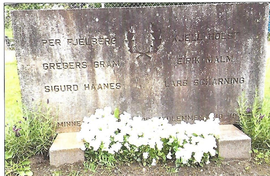
Minnestenen over falne medlemmer av Njård. Stenen er plassert ved Njård tennisbaner.