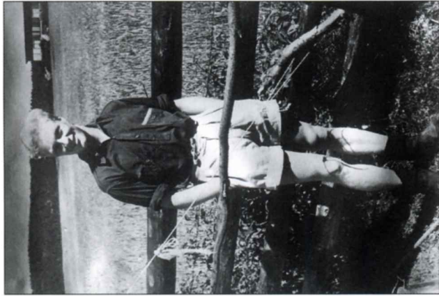
På arbeidsleir i Leksand, Dalarna, Sverige, sommeren 1940.